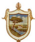
Comune di Fiumicello